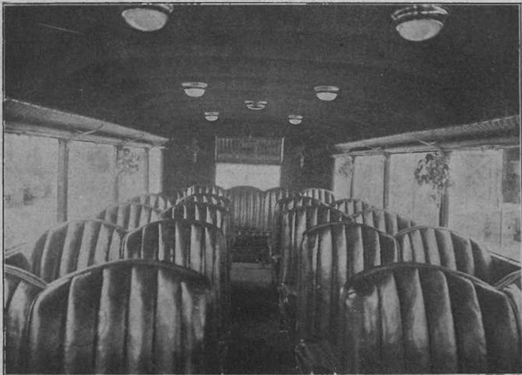
Wygodnie i elegancko urządzone wnętrze autobusu „TKA. w Polsce”, kursującego na linii Poznań—Warszawa.