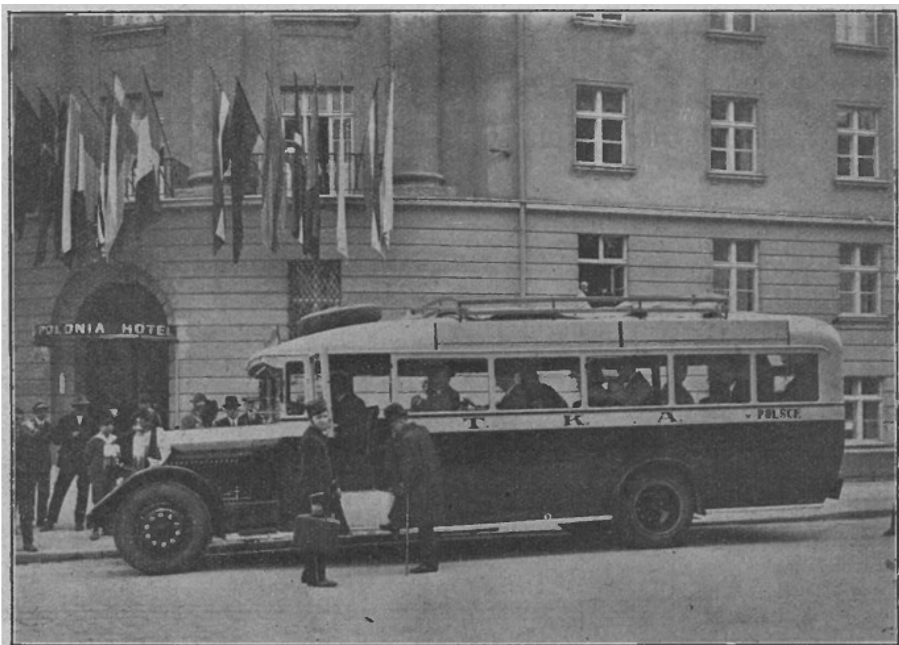
Autobus „T. K. A. w Polsce“ zabiera pasażerów z hotelu wystawowego „Polonia“.